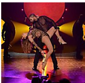
A JLo se le rompe el traje al final de un espectáculo