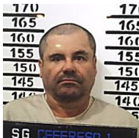
Orden de tacos delata escondite de El Chapo