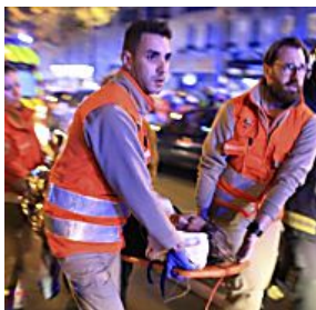
Atacantes de París cometieron atrocidades antes del atentado