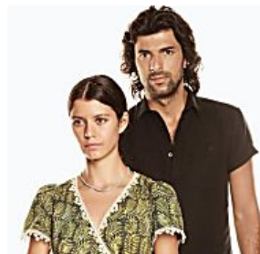
Novio de la protagonista de “Fatmagül” murió en un choque