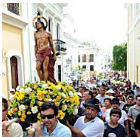
Muerte cruel detrás del festival de la calle San Sebastián